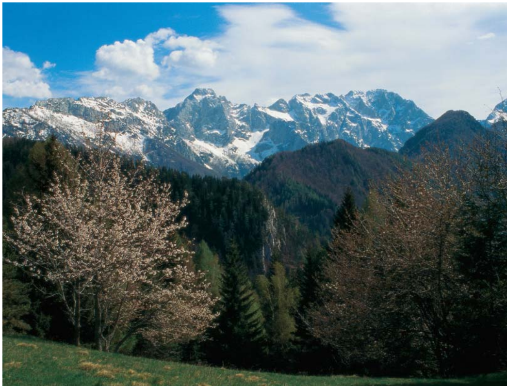
Življenjsko okolje ogroženih ptic.

Natura 2000 je ekološko omrežje, ki se postopoma razvija v vseh državah Evropske unije. Vanj so vključena vsa območja, ki so pomembna za ohranjanje ogroženih rastlin, živali in njihovih življenjskih okolij.