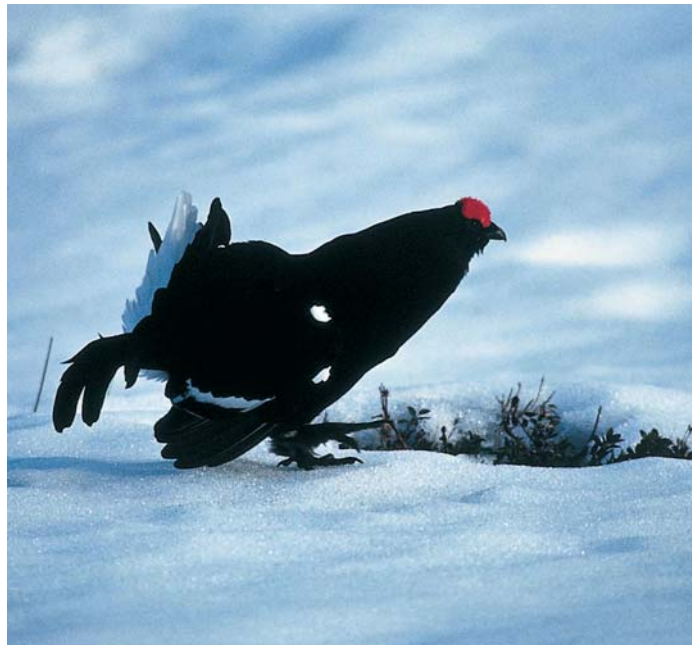
Ruševac je zelo družabna vrsta in ponavadi živi v skupinah.

Če mora zaradi vsiljivcev bežati, v mrazu izgubi veliko energije. To utegne biti zanj celo usodno.