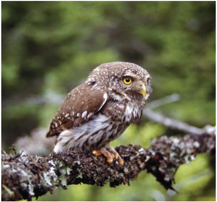
Kamniško Savinjske Alpe in vzhodne Karavanke so za malega skovika najpomembnejše bivalno okolje v Sloveniji.

Hrani se z manjšimi glodalci in pticami. Gnezdi v opuščenih duplih detlov in žoln. Najraje ima smrekove gozdove z vrzelmi in jasami, kjer lahko lovi plen.