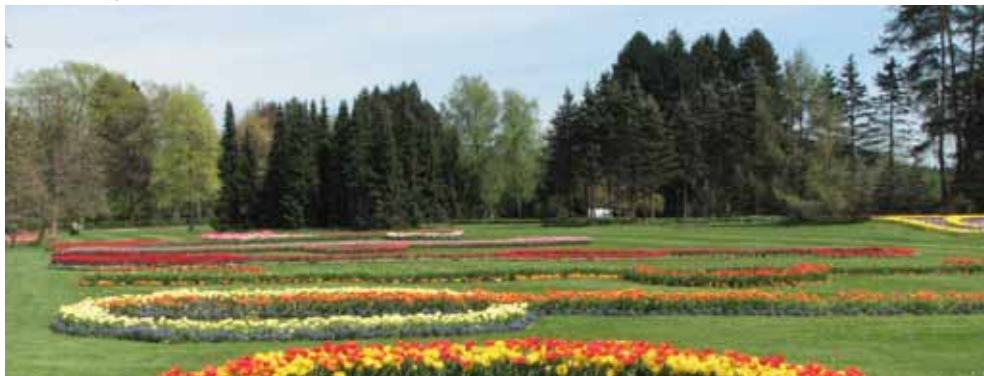
Arboretum Volčji Potok

Vaš oddih v Kamniku in okolici pa nadgradite z okušanjem kamniških kulinarčnih dobrot, izborom kamniških jedi iz projekta Okusi Kamnika.