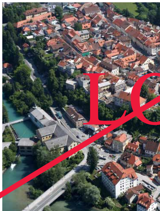
Kranj iz zraka

Mesto se ponaša s hišami z lepimi arkadnimi dvorišči, mestnim obzidjem s stolpi ter z galerijami in muzeji. Cerkev sv. Kancijana velja za eno najlepših gotskih cerkva na Slovenskem. Gorenjski muzej, ki hrani svoje zaklade o zgodovini mesta v Mestni hiši, v gradu Khislstein in v Prešernovi hiši. Atraktivna mestna znamenitost so Rovi pod starim Kranjem, ki predstavljajo pomembno tehniško dediščin, v njih pa se skozi celo leto odvijajo različni dogodki. V Kranju so živeli tudi veliki Slovenci, ki so s svojim