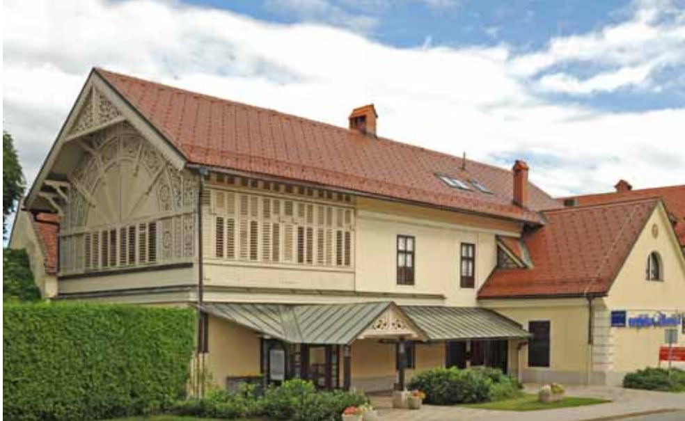
Hribarjeva vila v središču Cerklj