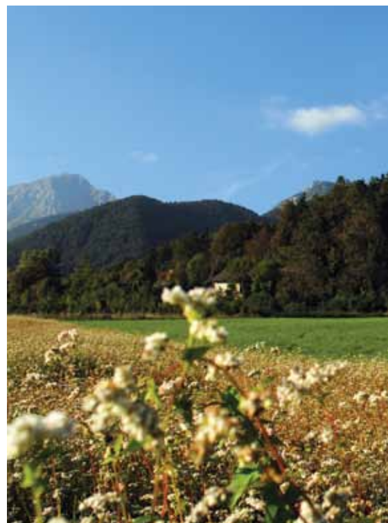
Grad Turn, v ozadju gora Zaplata

P od strmimi pobočji Storžiškega pogorja, tam, kjer reka Kokra izstopi iz soteske in priteče na ravnino kranjskega polja, leži Preddvor. Že več, kot devet stoletij ga v ozadju kot mogočna gorska kulisa krasijo vrhovi Storžiške gorske skupine, ki marsikateremu obiskovalcu vzbudijo željo, da se povzpne nanje. Storžič, markanten dvatisočak z značilno piramidasto obliko, ali pa travnata Zaplata s skrivnostno krpo gozda na sredi, pa številne cerkvice na gričih pod njimi, nam lesketajoče odsevajo svojo čudovito podobo na gladini preddvorskega jezera Črnava. Preddvor je zato cilj mnogih obiskovalcev. Lep in občudovanja vreden je v vsakem letnem času, pa naj si bo takrat, ko se povzpne na vrhove nad njim, ali pa odveslamo na sredino jezera in prisluhnemo tišini in šumenju dreves, ki pojejo svojo večno zasanjano pesem. Od tod nihče ne odide praznega srca in vsak, ki zna občudovati naravo, se v Preddvor vedno rad vrača.