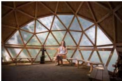
Naravni zdravlilni gaj v Tunjicah