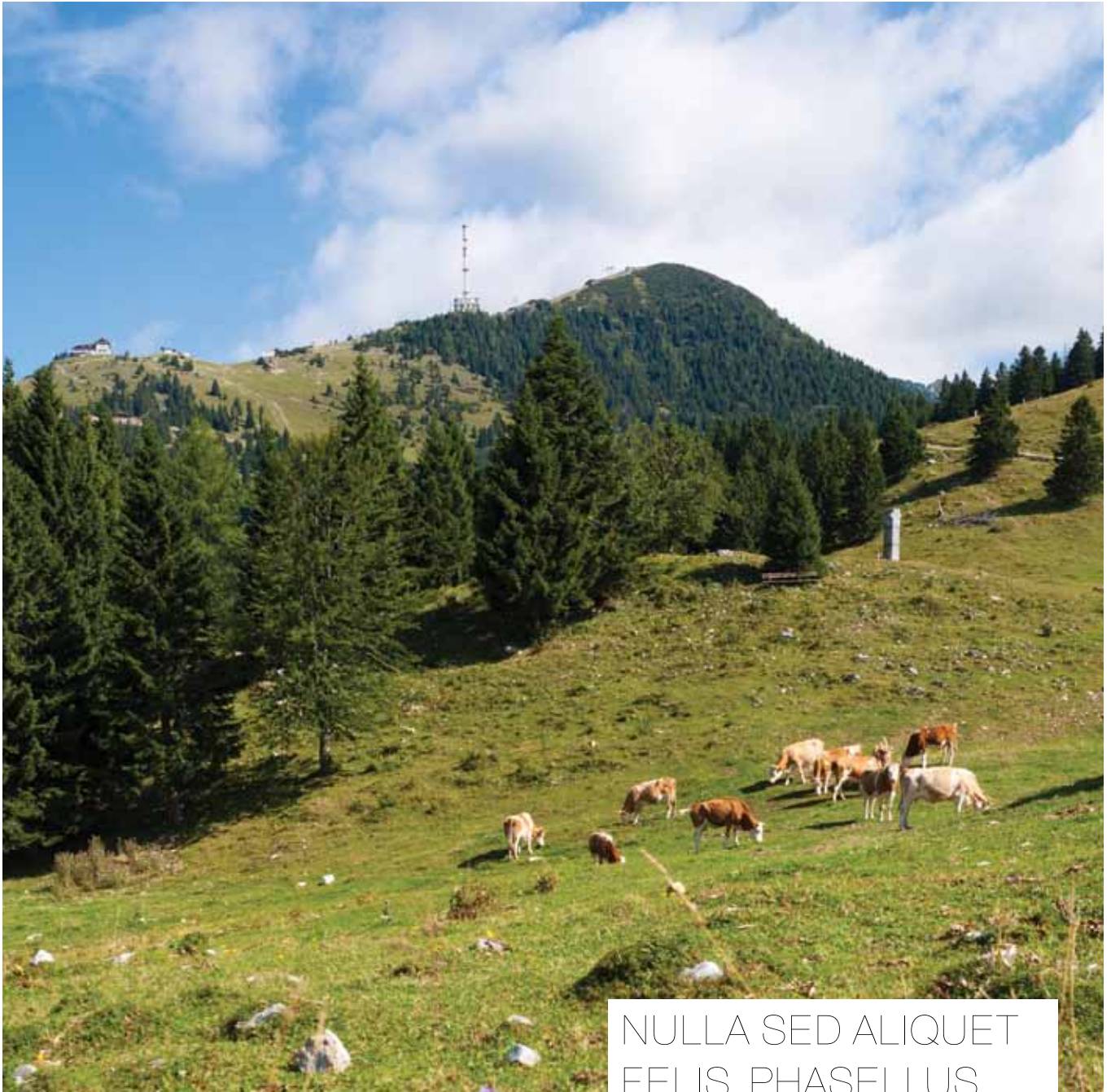
Lorem ipsum dolor sit amet, consectetur adipiscing.

NULLA SED ALIQUET FELIS. PHASELLUS IMPERDIET HENDRERIT MASSA. PROIN EGESTAS UT SAPIEN UT CURSUS, FUSCE JUSTO RUTRUM