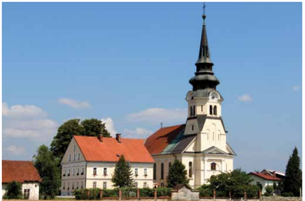
cerkev sv. Marijete v Vodicih

Za kulinarično razvajanje s tipičnimi slovenskimi jedmi poskrbijo v vrhunskih gostinskih lokalih: v Gostilni pri Anzeljnu, na Turistični kmetiji Lavrič, Gostilni Skaručna in Klubu gurmanov Skaručna, kjer lahko najamete sobo ali pa se udeležite kuharskega tečaja.